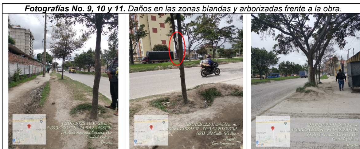
Fuente. Radicado SDA No. 2022IE183016. Visita técnica del 12 de julio de 2022.

A pesar de lo anterior, en el mes de julio de 2022 la Subdirección de Control Ambiental al Sector Público programó visitas masivas de control a los proyectos constructivos que se consideraran críticos, debido a las condiciones en las que se estaban llevando a cabo las actividades constructivas, y dentro del listado de las obras se postuló al proyecto Urbanización Estancia 70; así pues, se llevó a cabo una nueva visita de seguimiento y control ambiental el día 12 de julio de 2022, identificando persistencia en las inconsistencias evidenciadas en las visitas previas: