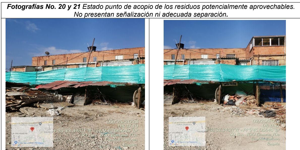
Fuente. Radicado SDA No. 2023IE47542. Visita técnica del 25 de febrero de 2023