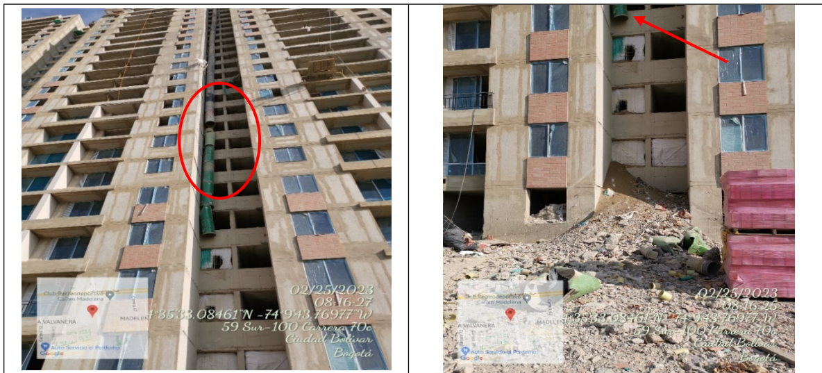
Fuente. Radicado SDA No. 2023IE47542. Visita técnica del 25 de febrero de 2023

Cabe mencionar, para el mes de febrero de 2023, la Alcaldía Mayor de Bogotá declaró emergencia ambiental en la ciudad debido a la calidad del aire, la cual fue afectada por las altas concentraciones de material particulado, por lo cual se requirió en campo el cubrimiento de los acopios de material granular, los RCD y mejoramiento del ducto para traslado de los escombros, ya que dadas las canecas metálicas faltantes, se generaba escape de residuos y material particulado a la atmosfera (Fotografías No. 22 y 23).