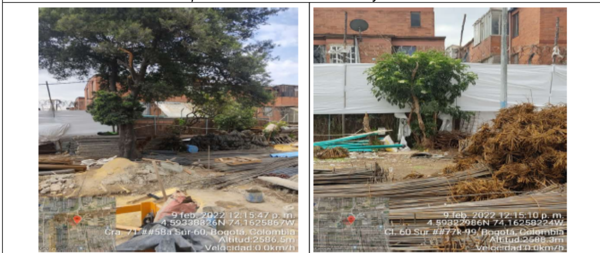
Fotografías No. 5 y 6. Individuos arbóreos sin protección y con afectaciones mecánicas por presencia de material ferroso y RCD.