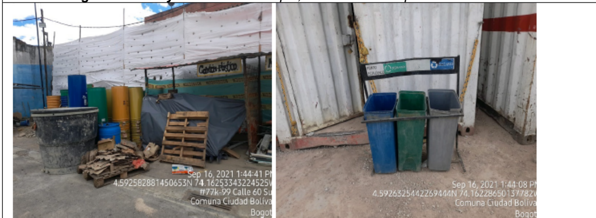
Fotografías No. 3 y 4. Puntos de acopio, sin adecuada separación de los residuos