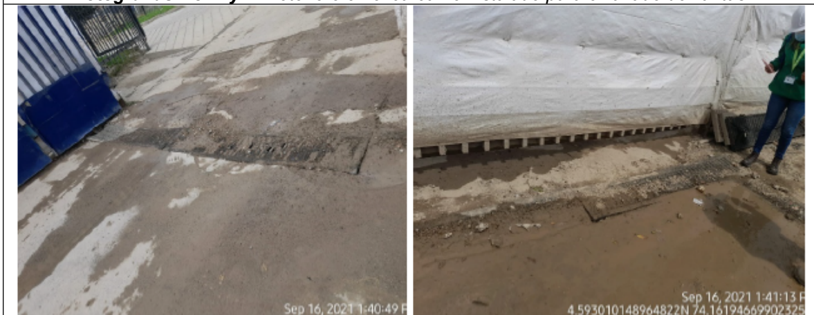
Fotografías No. 1 y 2. Deterioro en el cárcamo instalado para el lavado de llantas.