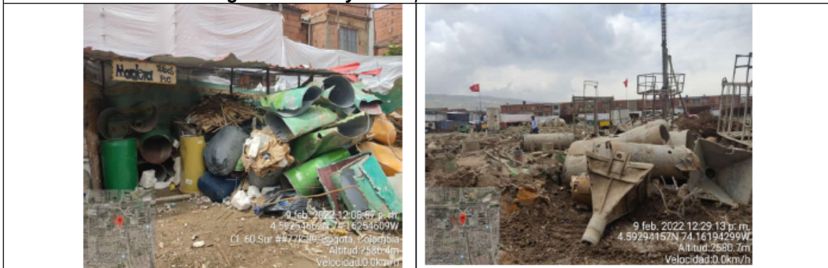
Fotografías No. 7 y 8. Acopios de residuos mezclados.